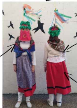
Jertse edo Alkandora zuria