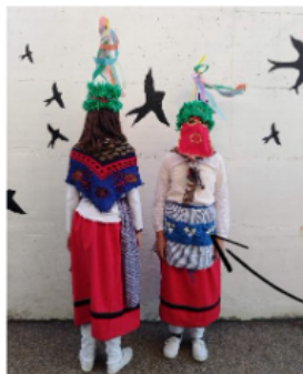
Edozein koloretako mantala