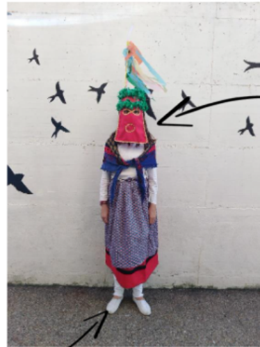
Maskarak ikastolan ditugu